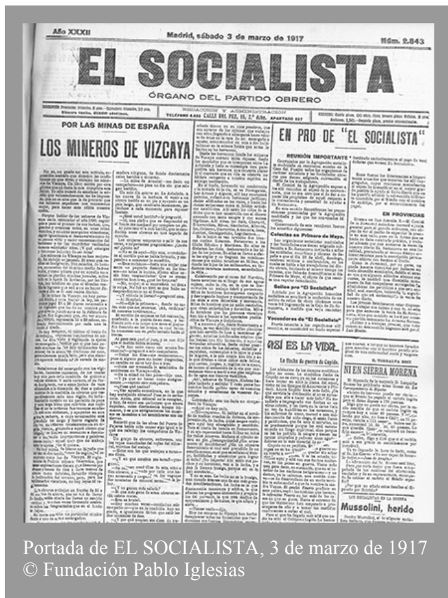
Portada de EL SOCIALISTA, 3 de marzo de 1917