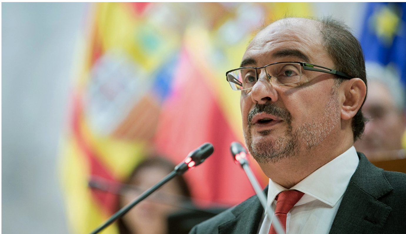
El presidente del Gobierno de Aragón, Javier Lambán

ARAGÓN / Aragón es la comunidad autónoma con mayor descenso del paro (un 12,78%) con respecto a febrero de 2016, 3 puntos porcentuales por encima del descenso a nivel nacional (9,68%). Somos la 2ª región con mayor descenso del paro registrado respecto al mes anterior: un 3,44%, muy por encima del leve descenso a nivel nacional (-0,25%). Respecto al comienzo de la legislatura: el número de parados registrados en Aragón ha disminuido en 13.736 personas desde junio de 2015, que supone un 14,8%. La disminución es 6 puntos superior a la de España, donde el descenso ha sido del 8,97%.