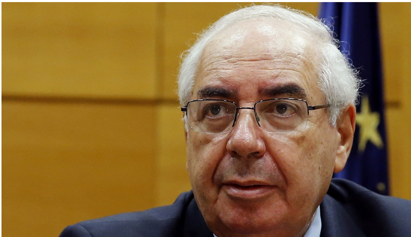
El portavoz del PSOE en el Senado, Vicente Álvarez Areces

MADRID / El portavoz del PSOE en el Senado, Vicente Álvarez Areces, preguntará al Gobierno qué piensa hacer para cumplir con el plazo de acogida de personas refugiadas de aquí al próximo mes de septiembre, que es cuando finaliza el plazo dado por la UE para que España acoja al total de 17.337 refugiados a los que se comprometió.