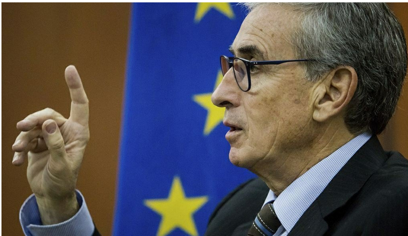
El eurodiputado socialista Ramón Jáuregui en una imagen de archivo

Esta situación tiene su origen en el incumplimiento por parte de Venezuela del Tratado Internacional Convenio de Seguridad Social entre España y Venezuela, que señala que "las prestaciones económicas, debidas por una de las partes contratantes en aplicación del presente convenio, se harán efectivas a los beneficiarios que residan en el territorio de la otra parte o de un tercer país".