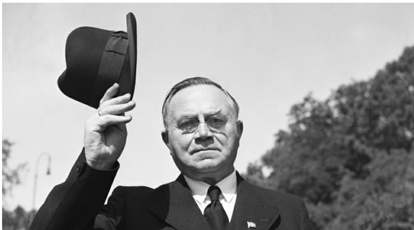
Johan Nygaardsvold, (1879-1952)