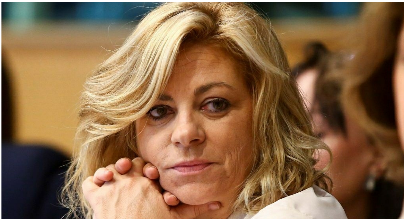
La eurodiputada socialista Elena Valenciano en una imagen de archivo